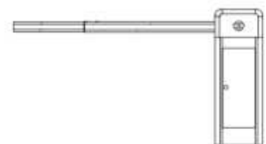
R: ตู้ดูฝั่งขวา