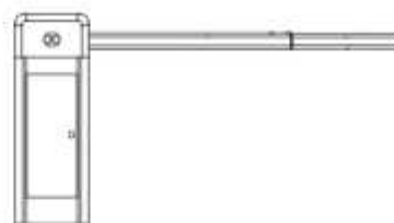
L: ตู้ดูฝั่งซ้าย